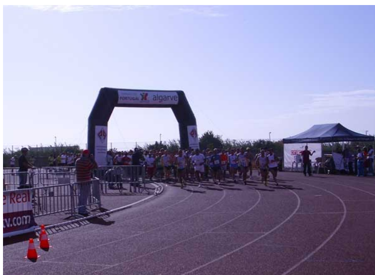
Concorrentes na partida da meia maratona